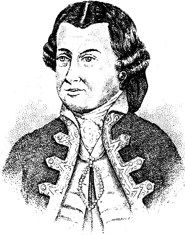
O fundador de Vila Bela, D. Antônio Rolim de Moura Tavares, Conde de Azambuja, Primeiro Governador da capitania de Mato Grosso (17-1-1751 a 2-12-1764).