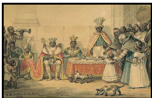
Coleta para manutenção da Igreja do Rosário – Jean Baptiste Debret

religião, mudanças configuram-se ainda mais lentas. Todas as imagens escolhidas relacionam-se de alguma forma a aspectos da religiosidade vivida e /ou praticada pela população. Foram selecionados grupos sociais e étnicos variados, pois todos estavam integrados na vida religiosa de forma plena através das irmandades, fossem negros forros, escravos, brancos pobres, pardos ou brancos ricos iv .