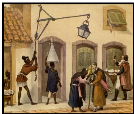
Primeiras ocupações da manhã – Jean Baptiste Debret

A prancha “Primeiras ocupações da manhã” nos apresenta a porta de entrada de uma loja de balas. Nos interessa aqui a dupla que está colocada quase no centro e suas ações: uma negra velha beijando um relicário de um irmão e também o homem que se encontra em segundo plano segurando um guarda-chuva. A negra e o irmão repetem gestos que foram legitimados pela sua repetição e ainda o são em