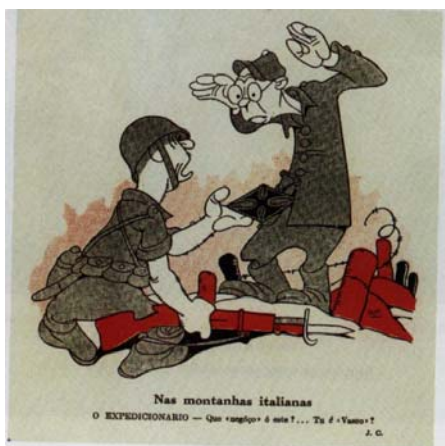
O expedicionário – Que “negóço” é este?... Tu é “Vasco”? Fig.2 – J. Carlos. Careta, 23/10/1944 em J.Carlos contra a Guerra

Estabeleciam-se, assim, pontos de contato com o dia a dia do leitor, buscando referenciais que simulassem o ponto de vista das pessoas. Em muitos casos, a guerra foi refletida a partir de suas conseqüências na vida material, como na charge intitulada “Os escombros”, onde vemos dois homens observando uma montanha de objetos, mesas, cadeiras, quadros, baldes, garrafas, latas, objetos do interior das casas, do cotidiano. “Lá em cima, bem no alto, a nação vitoriosa colocará a sua bandeira”, diz o personagem de olhos arregalados que aponta para cima. 13 Ou, ainda como no caso onde vemos uma longa fila de mulheres numa das ruas da cidade. Uma senhora se aproxima do final da fila e pergunta: “ – Ainda há batatas? – Não, senhora. Agora está distribuindo telegramas narrando vitórias”. 14