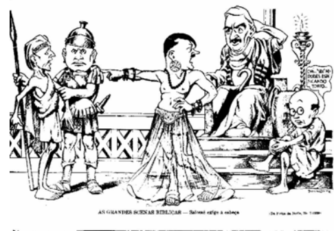
Fig.4 – Belmonte. Grandes Cenas Bíblicas – 29/07/1939 - Folha da Noite em LAGO, p.107