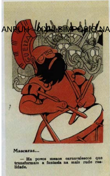
Fig.1 – J.Carlos. Careta, 11/03/1939 em J.Carlos contra a Guerra