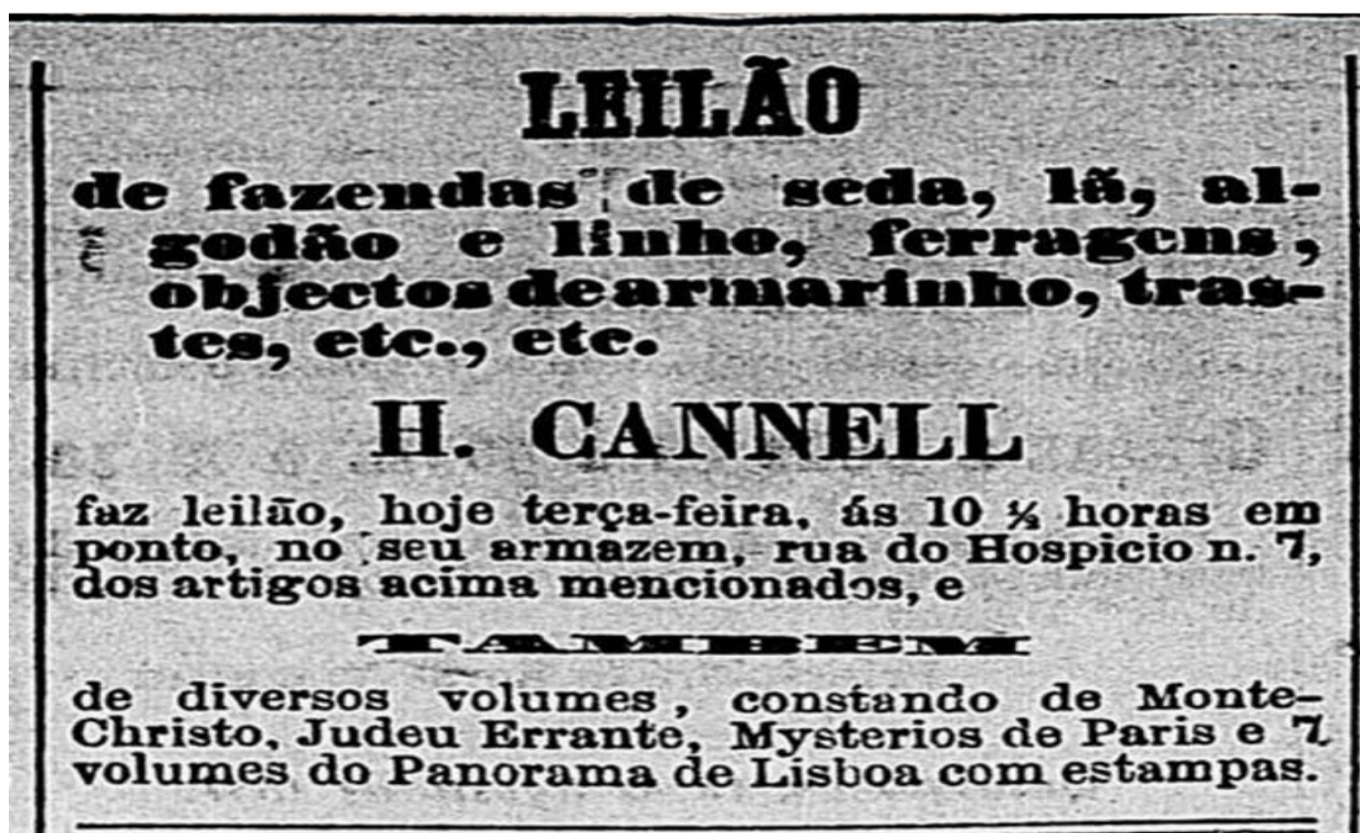
Imagem 1: Anúncio de leilões de livros.

Este anúncio pode servir de protótipo para explicar algumas informações que poderiam ser encontradas nesses reclames. Na primeira linha temos em destaque “LEILÃO”, ou seja, o anúncio quer chamar atenção para que tipo de propaganda é esta que o leitor está colocando seus olhos. Em seguida há uma breve descrição de itens à venda “fazendas de seda, lã (...)”, o que nos indica que nessa venda em hasta pública estaria sendo posto à em leilão diversos itens, tais como roupas, ferragens, objetos de armarinho, trastes etc., logo, itens variados. Mais abaixo aparece o nome do leiloeiro que se encarregará desta venda, “H. Cannell”, a data, a hora e o local no qual o pregão será realizado. Contudo, antes de dar o anúncio por encerrado ainda somos informados de mais alguns itens que compõem os bens em leilão, tratam-se de “diversos