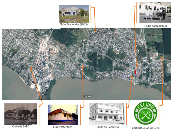
Figura 3 - Mapa com a relação dos Clubes da cidade

Os clubes estão alocados em diferentes bairros e vai ser para onde os foliões vão migrar. Ao pensar nesses clubes, hoje, temos somente dois em funcionamento, mas não realizam mais bailes de carnaval, que é o Clube Veteranos, e o Clube Itapuí. O Clube do Comércio é a atual sede do poder legislativo do município, e os demais não existe mais.