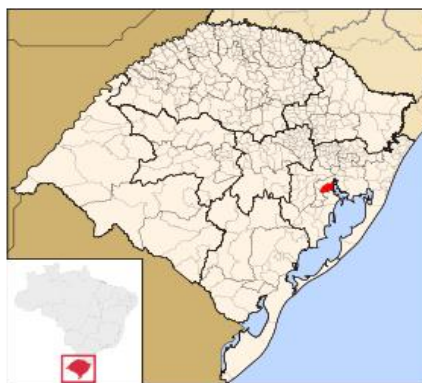
Figura 1 - Mapa da localização de Guaíba

Para observarmos a dinâmica da cidade de Guaíba, podemos elucidar uma breve e rápida história do município, pois está localizada às margens oeste do Rio Guaíba, e a vinte e cinco quilômetros da cidade e capital do estado do Rio Grande do Sul, Porto Alegre. A cidade pertence como distrito da capital, conquistando sua emancipação somente no ano de 1926. Desta forma essa cidade vai estar influenciada com a sua relação com a capital.