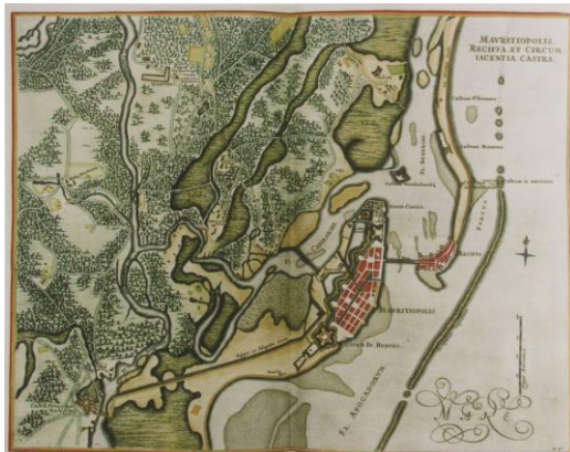
Imagem 2: Cidade Maurícia: 1644 (Reis, 1997)