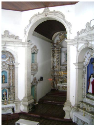
Imagem 4: Foto do arco da capela mor. Sobre o arco-cruzeiro da sua capela-mor lê-se em relevo das datas "1752" e "1778."

Sobre o arco do altar-mor é possível ler a inscrição em relevo dos anos de “1752” e “1778” (Imagem 4). Essa primeira data, de acordo com as informações da câmara municipal citada antes, é o ano da aquisição do terreno e de início da construção da igreja. O diário do Governador Correa de Sá também registra que ele esteve presente tanto no assentamento da primeira pedra da obra, em 29 de junho de 1752, como acompanhou a procissão que trouxe o padroeiro para a igreja em 24 de agosto de 1754 assistindo a missa no novo templo no dia seguinte: