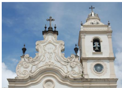
Imagem 1: Frontispício da Igreja de São José do Ribamar.

XVII. Memória e data que nos remete ao último ano da ocupação holandesa em Pernambuco.