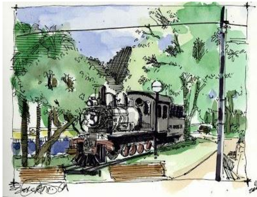
Imagem 4: Beto Candia. Maria Fumaça Phantom. 2011. Disponível em:

http://brasil.urbansketchers.org/2011/11/maria-fumaca-phantom-da-usina-santa.html . Acesso em: 04-02-2016