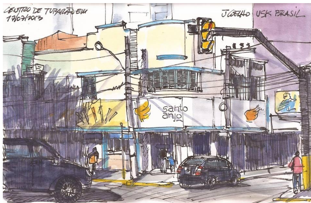
Imagem 5: Jony Coelho. Farmácia Santo Anjo na rua Lauro Muller. 2013. Disponível em:

A Maria Fumaça “Phantom”, da Usina Santa Amália, foi doada ao município de Ribeirão Preto pelas Indústrias Matarazzo e instalada em 1912. A máquina está situada na praça Francisco Schmidt, na Vila Tibério ao lado da Rodoviária da cidade. A situação em que se encontra esse patrimônio histórico é lamentável e de calamidade pública. Atualmente a locomotiva serve de banheiro e esconderijo de drogas, dos inúmeros desocupados que disputam o local. Uma pena! (2011)