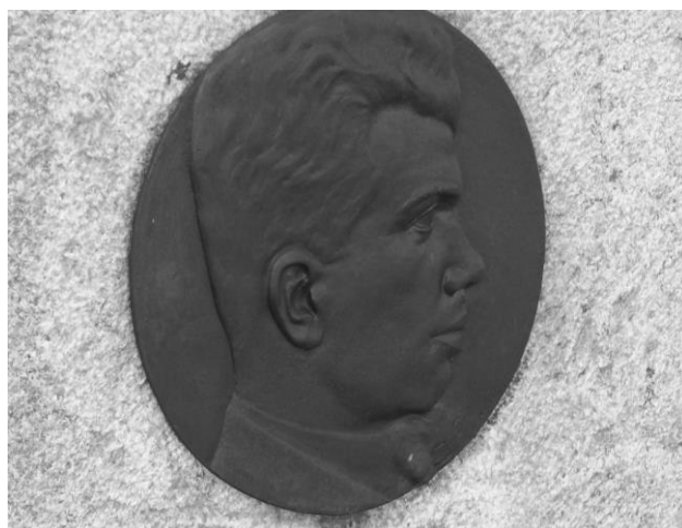
Fig. 6 Detalhe do túmulo Monsã, retrato em relevo, bronze. Quadra 44.