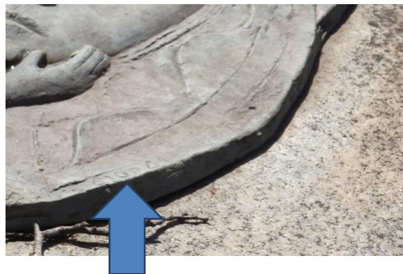
Fig. 10 Túmulo Família Costa Chiabi, Nossa Senhor e o menino Jesus, detalhe, Quadra 15, Cemitério do Bonfim.

A seta indica a assinatura de Bruno Giorgi