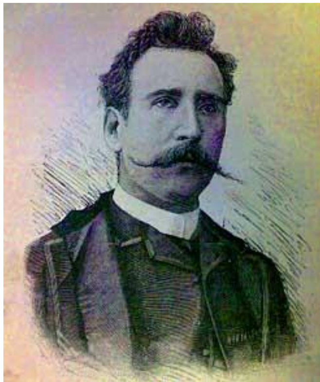
Fig.7 Ettore Ximenes