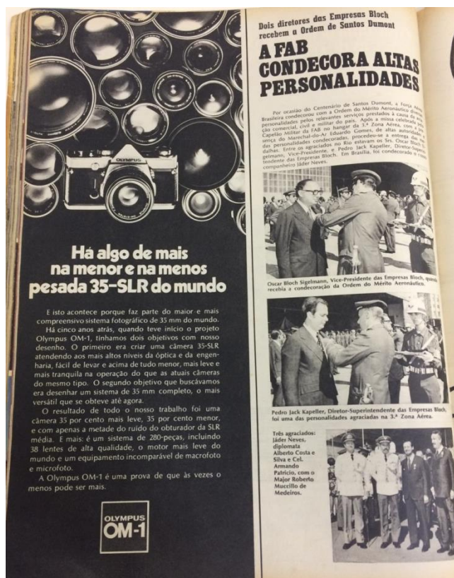
Imagem 3: Página 98.

Já o verso da folha, é dividido no meio verticalmente. Do lado esquerdo da página, um anúncio da câmera fotográfica 35-SLR, da OM-1 em um fundo preto, com a imagem da câmera na parte superior e logo abaixo a frase em branco “ Há algo de mais na menor e na menos pesada 35-SLR do mundo ”. Já do lado direito, a manchete em preto no fundo branco “A FAB CONDECORA ALTAS PERSONALIDADES”, seguido por três fotos.