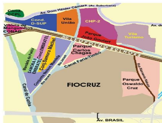
Figura 1. Desenho ilustrativo da distribuição das Comunidades de Manguinhos em 2013.