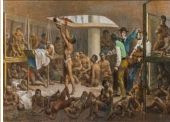
Uma cena comum nos porões dos navios que transportavam africanos para o Brasil, século XIX.