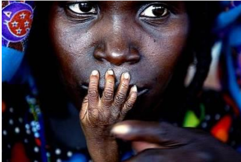
Mulher nigeriana com um bebê no colo - fotografia de Finbarr O'Reilly, 2005

Fonte: http://www.kavkaz-uzel.eu/blogs/929/posts/5912