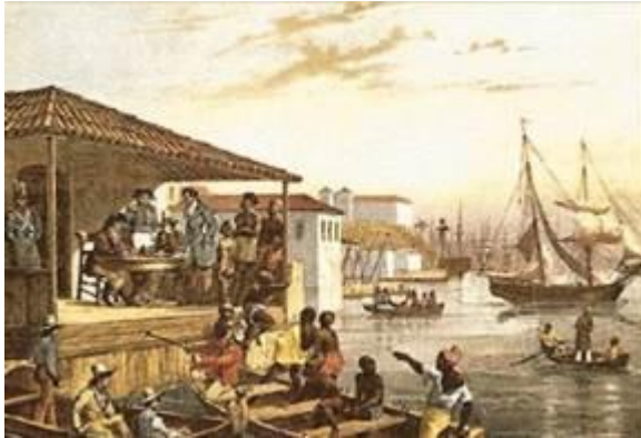
Representativa do comércio de mão de obra escravizada no Brasil no século XIX.