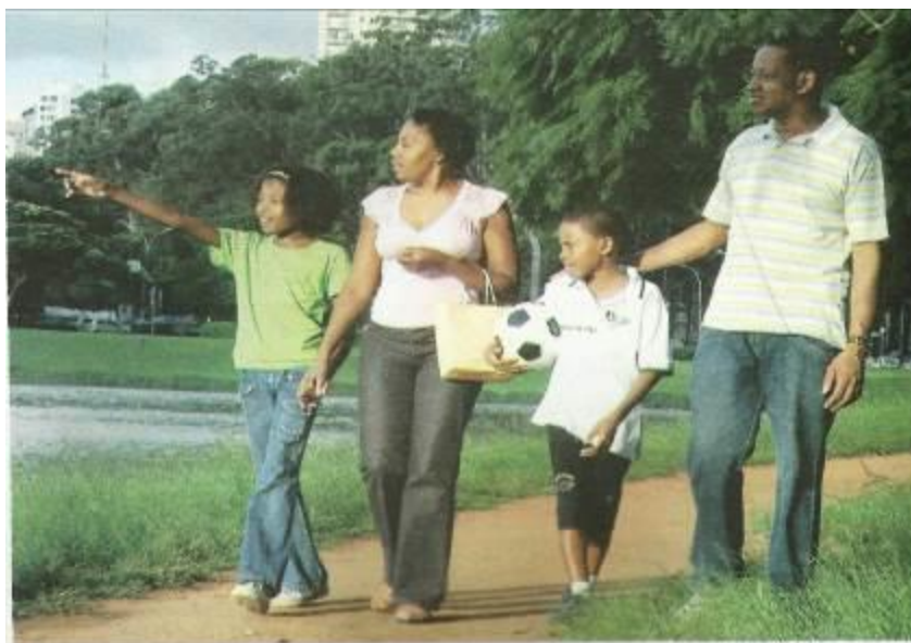
Família brasileira de ascendências africanas passeia no parque do Ibirapuera, em São Paulo. Fotografia de 2008.